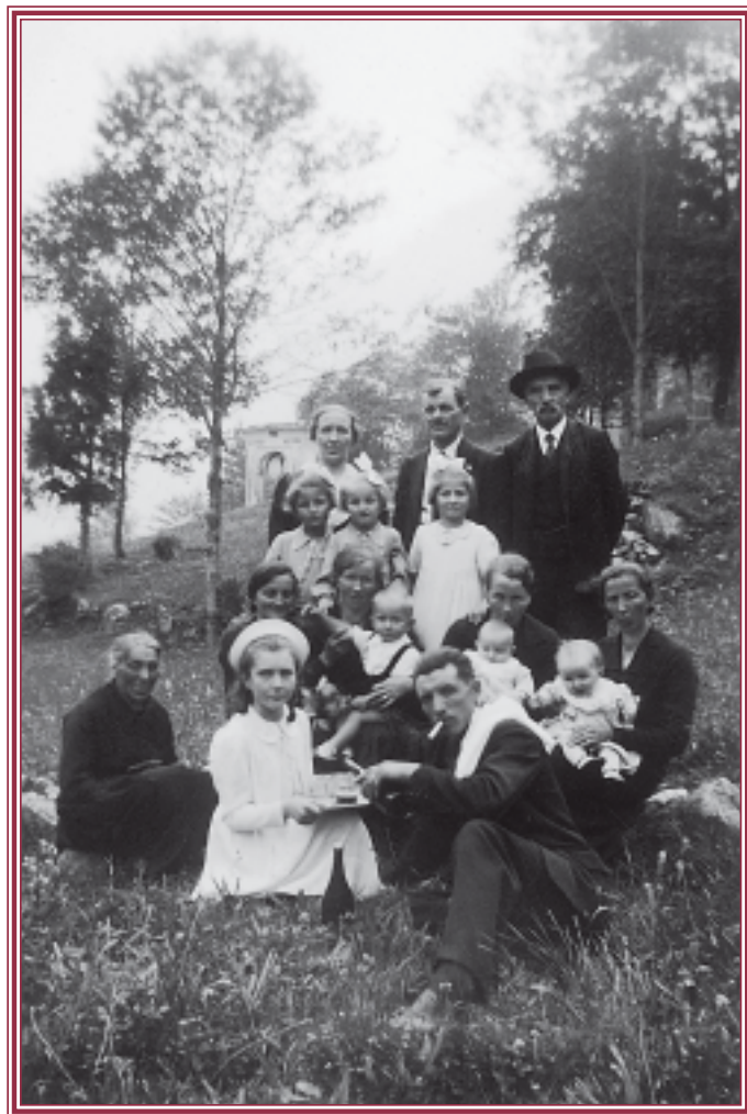
Pique-nique au Sanctuaire de Voury le 15 août 1939